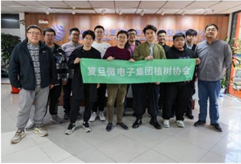
公司复微植树协会